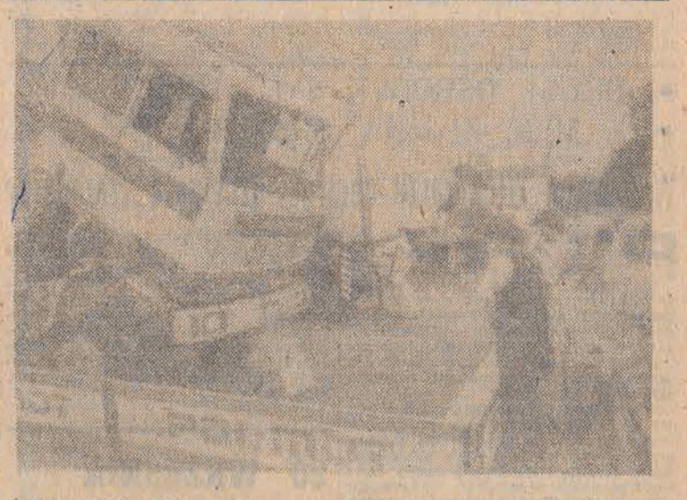
Lipsk, NRD. Goście międzynarodowych targów w Lipsku z zainteresowaniem oglądają ekspozycję polskiej CHZ Pol-Mot, na której pokazano m. in. nowy ciągnik siodłowy Jelcz C 620.

Rzecznik prasowy rządu PRL — min. Jerzy Urban złożył następujące oświadczenie w związku z przemówieniem kanclerza RFN Helmuta Kohla w Brunshwiku: W dniu 2 września br. kanclerz federalny RFN Helmut Kohl wygłosił w Brunshwiku na wiecu tzw. „Związku Wypędzonych” przemówienie, w którym m. in. odniósł się do problemu stosunków między RFN a PRL. Zastanawiający i symptomatyczny jest już sam fakt uczestnictwa szefa rządu federalnego w centralnej imprezie rewizjonistycznej, imprezie organizacji których program i działania polityczne jawnie zmierzają do podważenia pokojowego ładu w Europie oraz przesycone są niebezpiecznymi dla Europy i świata wielokogerskimi hasłami.