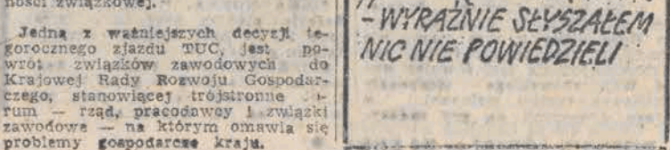
- WYRAŹNIE SEYSZALEM NIC NIE POWIEDZIELI