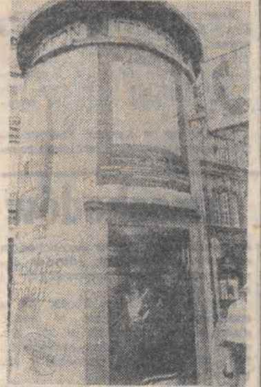
Na podwójne zastosowanie słupów ogłoszeniowych wpadły władze swajcarskie miasta Bazylei instalując wewnątrz słupów automaty telefoniczne.

Premier Libanu Rażid Karami ostro potępił Stany Zjednoczone za skorywanie się z prawa weta w Radzie Bezpieczeństwa przeciwko projektowi rezolucji libańskiej, domagającej się od Izraela ściśle o przestrzegania praw ludności cy-