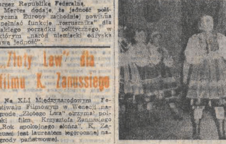
WESIELE NA SALA GMINY CZYTAŁ NA STRONIE 1.