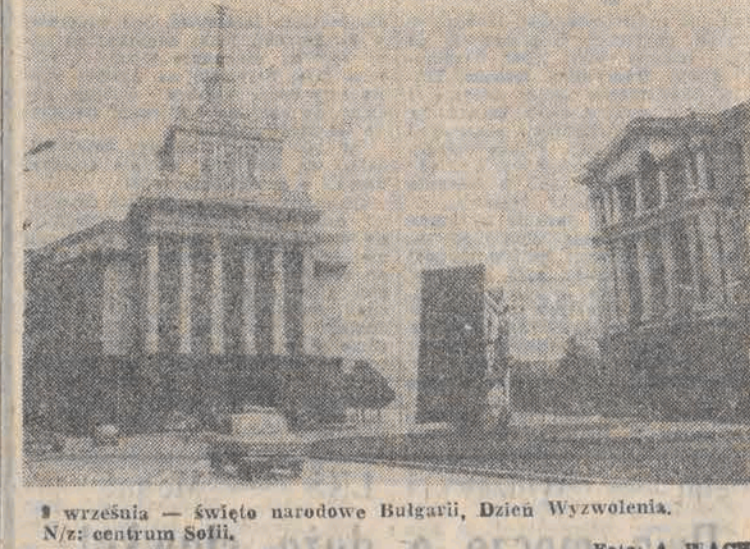
9 września - święto narodowe Bułgarii, Dzień Wyzwolenia. Niz: centrum Solli.