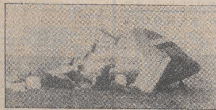
Nr.: samolot AN-2 po katastrofie.