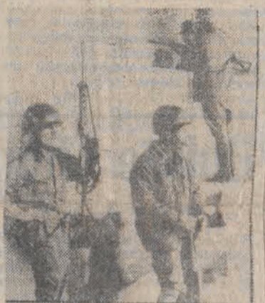
Nr.: oddziały armii przy wejściu do miasteczka uniwersyteckiego.

Przedstawiając trudności gospodarcze, jakie przeżywa Nikaragua, min. Martinez podkreślił znaczenie pomocy udzielanej jego krajowi przez państwa socjalistyczne. Jest to tym ważniejsze — dodał — iż Stany Zjednoczone — forsując tezę o rzekomym zagrożeniu ze strony Nikaragui — usiłują także poprzez restrykcje ekonomiczne złać jej gospodarkę i obalić popieraną przez rząd rewolucyjny. (PAP)