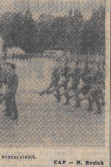
Na zdjęciu: podczas uroczystości.