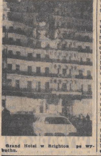
Grand Hotel w Brighton po wzbuczeniu.