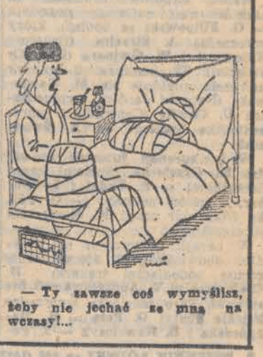
- Ty zawsze coś wymyślisz, żeby nie jechać ze mną na wczasy!...