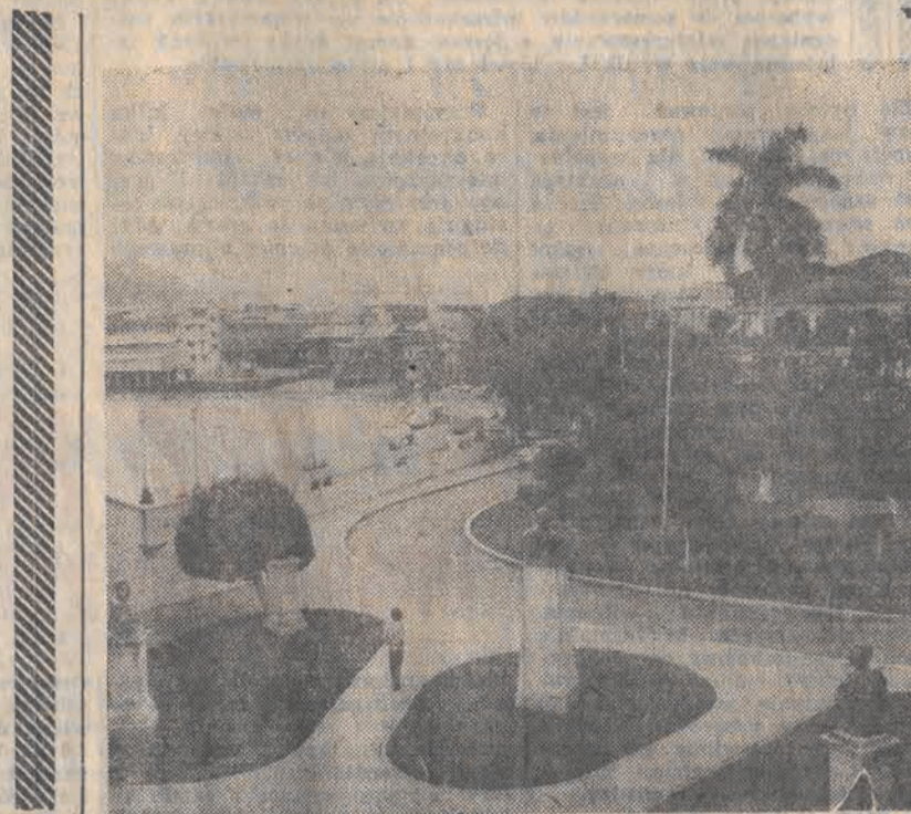
Panama. Jeden ze skwerów w Panamie — stolicy kraju.

Miasto — to zupełnie nowe pokolenie, wychowane w cieple (średnia temperatura roku w centralnej Mongolii — 0,4 i silne wiatry), w pobliżu nowoczesnych szpitali, w mieszkaniach z bieżącą wodą, kanalizacją, obok szkół, wyższej uczelni. Młodzi w mieście to także rozwój przemysłu przetwarzającego surowce, które dotychczas marnowały się w stepie.