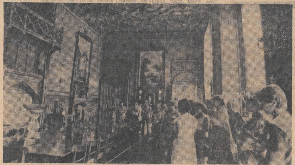
XIX-wieczny pałac w Alupce na Krymie (ZSRR) projektowany przez E. Blaira i jego piękne wnętrza są atrakcją dla turystów zwiedzających to miasto.