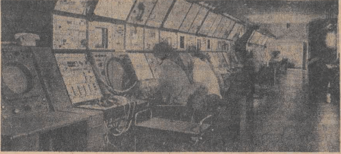
Tak wygląda sala operacyjna w Centrum Kontroli Ruchu Lotniczego. Na pierwszym planie kontrola zblizania, w głębi — kontrola obszaru.

Ważnym elementem jest także obserwacja i kontrola obszaru. Sala jest zaciemniona, przez całą jej długość ustawione są pulpity, przy których pracują kontrolerzy.