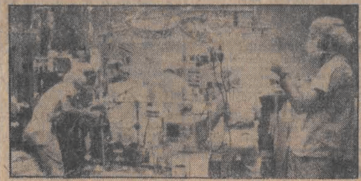
Jak już pisaliśmy, w szpitalu Loma Linda (w pobliżu Los Angeles) dokonano pierwszej na świecie operacji przeszczepienia serca młodego pawiana 14-dniowemu niemowlęciu. Dzisiaj otrzymaliśmy zdjęcie zrobione podczas operacji.