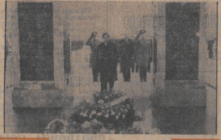
Na zaproszenie ministra spraw zagranicznych PRL 29 bm. przybył z oficjalną wizytą do Polski minister spraw zagranicznych Republiki Finlandii Paavo Vaerynen.

Na warszawskim lotnisku Okęcie obecni byli ambasadorowie Jan Zaleski i Olavi Rautio. Stosunki polsko-fińskie opierał powitał minister Stefan Olszowski. (Dalszy ciąg na str. 2)