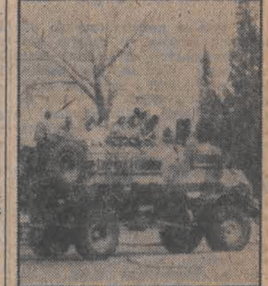
W wielu miastach RPA doszło do nowych demonstracji ludności afrykańskiej. Policja ustawiła brutalnie rozprószyć demonstrantów używając gazów łzawiących i trosowanych psów. N/z: zmotoryzowana policja w Soweto.

Złoty medal dla Polski zdobyły na VIII Międzynarodowej Wystawie Wynalazków i Nowości Technicznych „Inwex 84” w Brnie krzemowe diody referencyjne BZY 566-584 z Ośrodka Badańczo-Rozwojowego Elektronicznych Układów Specjalizowanych „Mera-Obreus” w Toruniu.