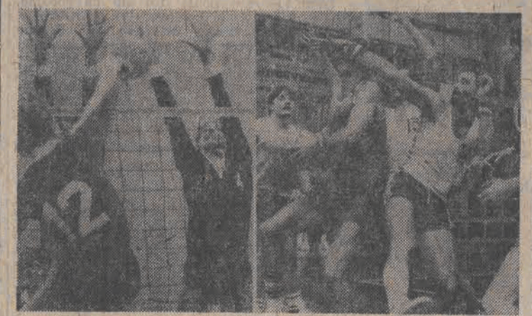
N/Z: w derbach siatkarek na Chojnach lepszy LKS. Koszykarze Społem pokonali Wybrzeże Gdańsk.