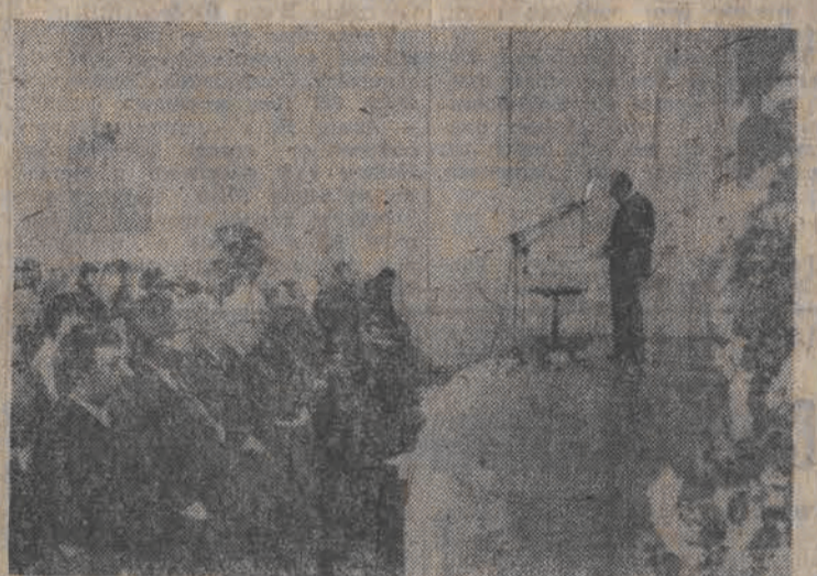
Na zdjęciu: okolicznościowe przemówienie wygłasza wiceprzewodniczący RK PRON, wicemarszałek sejmu Jerzy Ozdowski.

W listopadzie 1918 r. do 123 latów niewoli, powstała do życia Polska niepodległa. Złocił się sen czterech pokoleń patriotów, padły graniczne stupy rozdzielające ojczyznę i ziemię pomiędzy zaborców. Na mapie Europy pojawiła się znowu Rzeczpospolita Polska jako niezawisłe państwo. Stało się to możliwe w wyniku rewolucyjnego wstania ludów naszego kontynentu i w następnym dniu woli narodu polskiego, wspartej wieloma zbrojnymi zrywami, ofiarą krwi i życia. Przed 66 laty Polacy porwali niewyważnym entuzjazmem podjęli dzieło odbudowy brzo państwowego, zjednoczenia terytorium, przywrócenia wielu poddańców międzyrodziami.