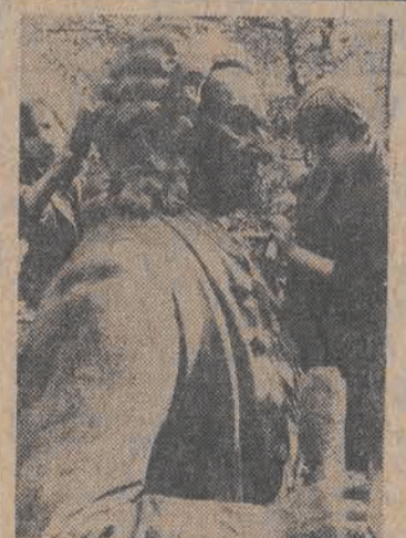
Pomnik Jana Sebastiana Bacha przed kościołem św. Tomasza w Lipsku poddany został renowacji. Niedługo cały muzyczny świat obchodzić będzie 300 rocznicę urodzin wielkiego kompozytora.

Uroczystość odbyła się w ośrodku im. Sessara Augusto Silva w Managui w obecności przedstawicieli najwyższych władz kraju. Oficjalne przejęcie władzy na 6 lat nastąpiło wraz z ukonstytuowaniem się Zgromadzenia Narodowego, w którym na 96 mandatów większość — 61 przypadła kandydatom sandinowskim.