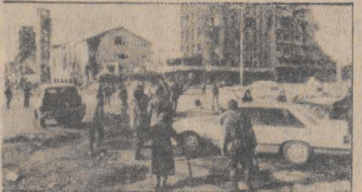
"Zielona linia" dzieląca Bejrut na część wschodnią i zachodnią...