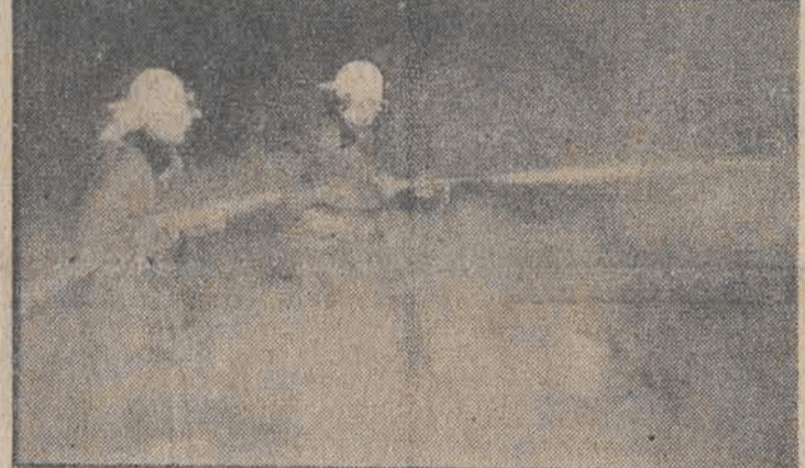
pojem śmieciowego basenu. Już było wiadomo że wybuchł duży pożar w największym w centralnej Polsce magazynie mebli...