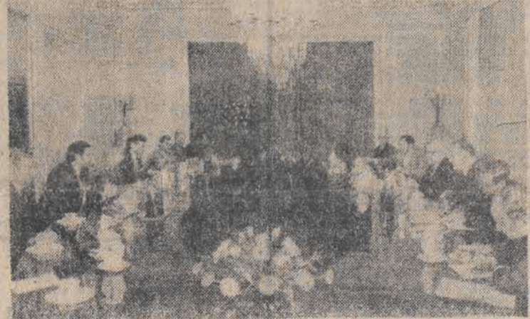
N z: podczas rozmów w Belwederze.

9 bm. przewodniczący Rady Państwa prof. Henryk Jabłoński przyjął w Belwederze kierownictwo Ogólnopolskiego Porozumienia Związków Zawodowych z przewodniczącym — Alfredem Miodowiczem. Przedstawiciele OPZZ poinformowali przewodniczącego Rady Państwa o aktualnych problemach ruchu związkowego w Polsce oraz o realizacji dokumentów i Zgromadzenia Ogólnopolskiego Porozumienia Związków Zawodowych w Bytomiu. Alfred Miodowicz zapoznał