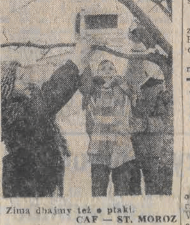
Zima dbajmy też o ptaki.

Ostatnie mroźne dni przyczyniły się do wzrostu liczby pożarów. Jak informuje Komenda Główna Straży Pożarnych, w dniach 7 i 8 bm.