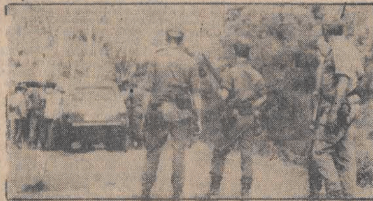
W Nowej Kaledonii trwa stan wyjątkowy. Francuscy żołnierze redują grupę Kanaków w pobliżu miejscowości Voh w zachodniej części wyspy.