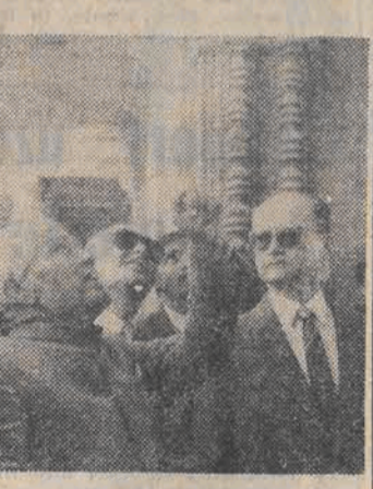
12 bm. przebywający s oficjalną wizytą w Indiach premier, gen. Wojciech Jaruzelski zwiedził zabytki architektury Kulab Minar w południowej części Delhi.

Rady Ministrów wpisali do księgi pamiątkowej następujące słowa: „Wizyta w muzeum poświęconym pamięci Jawaharlala Nehru stała się dla mnie okazją do głębszej refleksji nad życiem tego wspaniałego człowieka, którego imię jest nie- rozerwalnie związane z losami wielkiego narodu indyjskiego, jego walki o wolność i niepodległość, o należne mu miejsce wśród narodów świata.