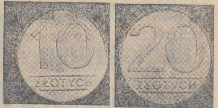
Narodowy Bank Polski wprowadza w marcu do obiegu nowe monety miedzianoniklowe o nominalach 20 zł i 10 zł. Dotychczasowe monety o tym nominalu znajdujące się aktualnie w obiegu zachowują nadal moc prawnego środka płatniczego.

Dziś w naszej rubryce „Stąd do nowoczesności” głos zabiera znany łódzki ekonomista, doc. dr hab. Cezary Jósefiak z Instytutu Ekonomii Politycznej UL, jeden z współtwórców „Kierunków reformy gospodarczej”.