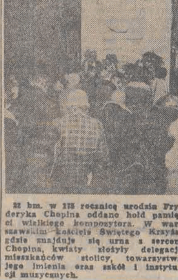
(Dalszy ciąg na str. 2)

Przeprowadzone analizy stanu gospodarki, terr i dokonane progno-