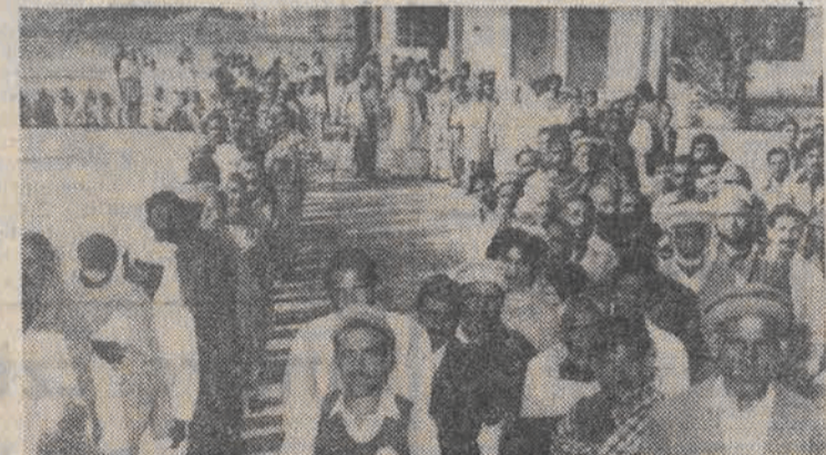
Na zdjęciu: głoszący mieszkańcy Bharaku.

Prezydent Pakistanu gen. Ziaul Haq rozwiązał we wtorek rano rząd tego kraju. W Islamabadzie ogłoszono wstępne niepełne wyniki wyborów do parlamentu które zostały przeprowadzone 25 bm.