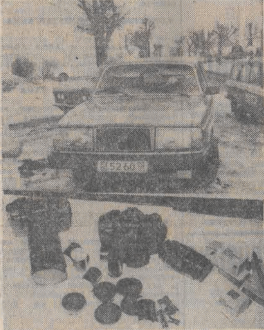
Jak informowała PAP attache wojskowy ambasady USA płk. F. Myer wraz z małżonką w dniu 21 bm. dokonali zdjęć obiektów wojskowych w okolicy Makowa Maz. poważnie naruszając w ten sposób status dyplomatyczny. Na zdjęciu: u góry — samochód marki „Volvo” z dużą rejestracją nie-dyplomatyczną, którą podróżował płk F. Myer z małżonką, u dołu — aparaty fotograficzne „Canon”, którymi dokonawali zdjęć.

Z pierwszych rezultatów wynika że frekwencja wyborcza wahała się od 30 do 50 procent. W czasie wyborów doszło do różnych incydentów. Agencja pisze, że śmierć poniosło 6 osób, a ponad 40 zostało rannych.