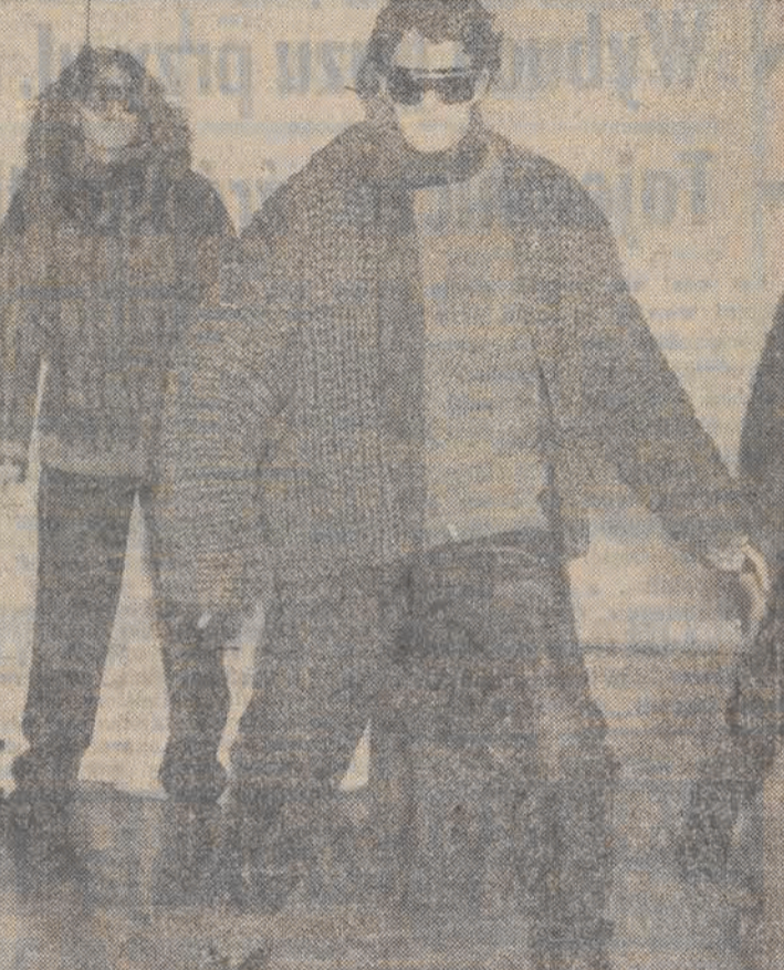
Oto stroje dla panów, zaprezentowane na pokazie w Paryżu przez japońską firmę Miyake. Widać, że stroje przeznaczone na duży mroz.