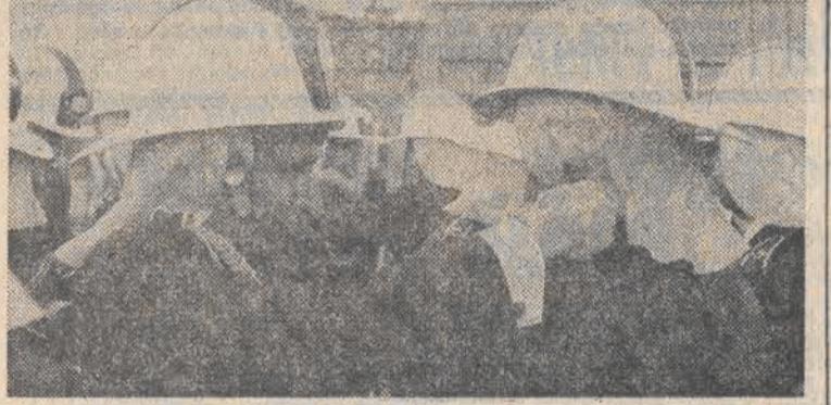
Podczas promocji chorążych pożarnictwa.

Podczas promocji chorążych pożarnictwa. W tym marzy z pewnością wielu młodych ludzi pociągających do służby. Dla niektórych oczekiwania te mogą się spełnić, o to roztoczą się okres rekrutacji do szkół pożarnictwa.