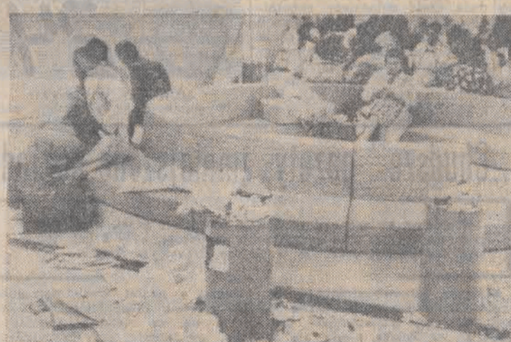
Na paryskim lotnisku już dawno przed wyjazdem strażk pracownikom odpowiedzialnym za sprzątanie. Pasażerowie z trudem poruszają się między stertami nie usuwanych śmieci i przepiętymi koszy...