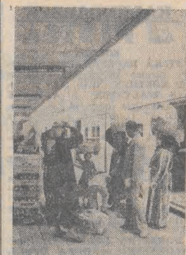
Może to wygodniejszy sposób niż noszenie ciężkich siatek w rękę