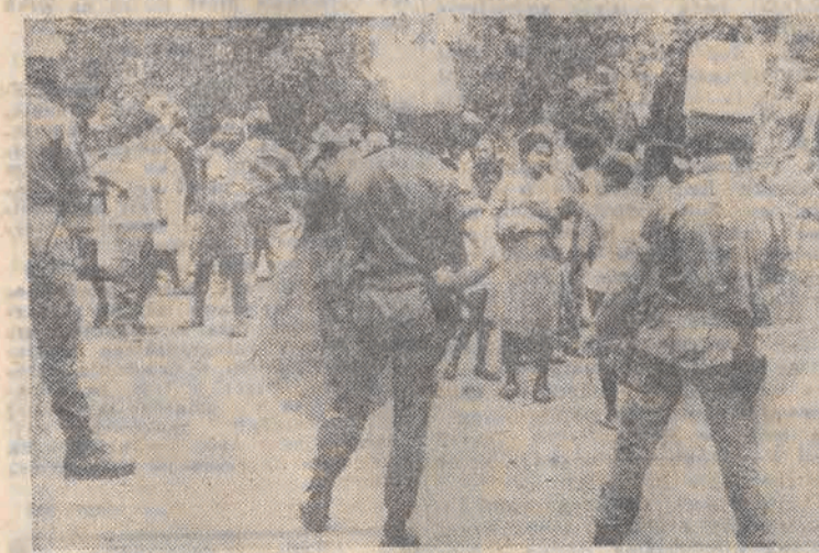
Nowa Kaledonia. Policja dokonała przeszukiwań w wieśkach położonych na wschodnim wybrzeżu Nowej Kaledonii. Rejon ten uważany jest za...