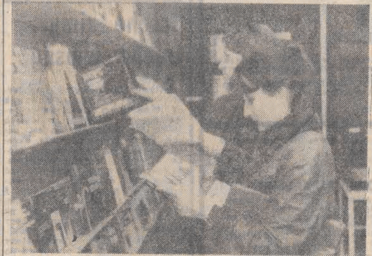
Dla uczczenia zbliżającej się 60 rocznicy zwycięstwa nad faszystami, w Berlinie otwarta została międzynarodowa wystawa książek, na której kraje demokracji ludowej prezentują ponad 4000 tytułów...