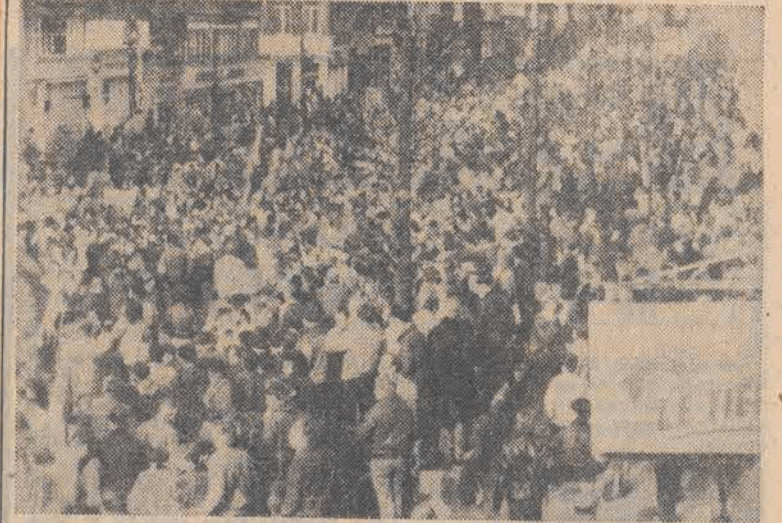
Tysiące osób uczestniczyło 17 bm. w niedzielę, w wielkim pochodzie protestacyjnym przeciwko decyzji rządu premiera Martensa, zezwalającej na rozmieszczenie na terytorium Belgii amerykańskich pocisków manewrujących z ładunkami nuklearnymi.