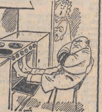
— Wróćś do łóżka, gdy będziesz miał ciepłe nogi!