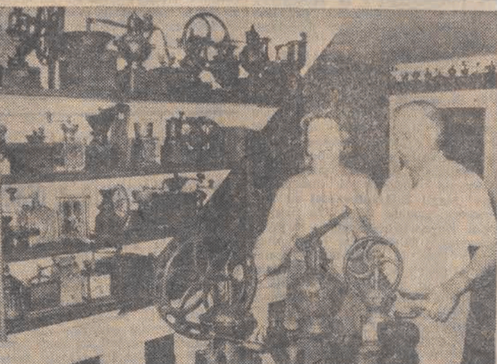
Ponad 300 rocznych młynków do kawy zdoła kawiarnia w miejscowości Fischbachau koło Monachium. Kolekcję tę zbieraono przez ponad 25 lat.

Jeszcze dłuższe trasy muszą pokonać przesyłki do Przemysłowego Przedsiębiorstwa Budowlanego, zawierające piasek pochodzący z tej woj. suwalskiego. (PAP)