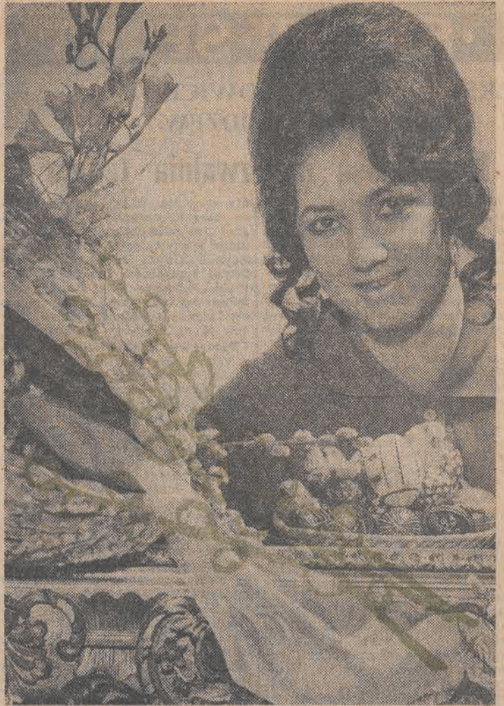
Wesołych i pogodnych świąt życzy Zespół „Dziennika Łódzkiego”

Wiceprezes Rady Ministrów PRL, Janusz Obodowski, przebywający z oficjalną wizytą w ChRL w dniach 31 marca - 4 kwietnia odwiedził trzy ważne ośrodki życia gospodarczego Chin - miasta Szanghaj i Kanton oraz specjalną strefę ekonomiczną Shenzhen, zapoznając się z realizacją obecnych reform gospodarczych i planami rozwojowymi gospodarki chińskiej. Delegacja polska zwiedziła liczne zakłady przemysłowe; drugi co do wielko-