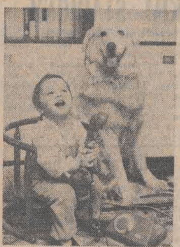
A teraz sadzonimy do mamy.