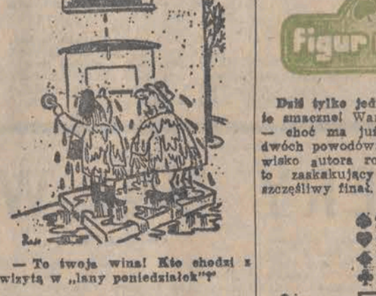
To twoja wina! Kto chodzi z wziętą w „lany poniedziałek”

dzienniczek * JAK PODAŁO wychozące w Zurichu piśmo „Sport”, po wysłuchaniu na torse w Paryżu austriacki koń Answer został wylosowany do konkursu antydingowej. Badając potem moc oddany do analizy, stwierdzono w organizmie rumaka sporą dawkę kofeiny. Komisja antydingowa przestała się dźwigać, gdy ustalila, że bezkwestionnie casując z koń zrobił co niepo należy, wyrzucił go stajenny, który jakoś nie skojarzył sobie, iż na swego podopiecznego rzucił podejrzanie, że obok popija en czarną kawę. Komisja uznała to zażalenie za wyraz uchylecia się od kontroli i przytożyła karę w wysokości 1500 franków szwajcarskich. * PRAWIEJ TU- RYSTA wie jak się ubrać, toteż nieprawdliwego poznaje się od razu, np. po krawacie. Gdy taki gość trafi do schroniska PTK na Biskupiej Kopie w woj. opolskim, traktuje się go bez pardonu i obcina się zębado osobę nieżyłkami. Ponieważ personel stosuje w takich rasach odpowiedzialności i wszystkie odbywa się na wesole, elegancko też nie wypadają zachowywać śmiertelnej powagi, choć zapewne kieszeń broni się przed następnym wydatkiem. W schronisku jest już spora kolekcja takich irofeów. * NA WYSTAWIE OGRONNICZEJ w Soham (Anglia) specjalną nagrodę przeznaczono dla tego, kto wyhoduje największą dynię. Otrzymał ją niejaki William Lennie, który przywiózł na konkurs e- kaz ważący 90,5 kg.