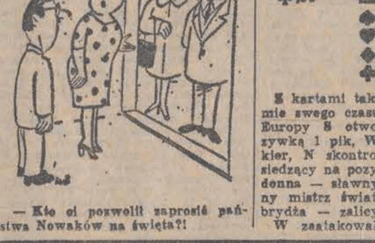
Kto ci pozwolił zaprosić państwa Nowaków na święta!

nie damą kier, na którą E rzucił karo, zaś Belladonna oczywiście przebił ją atutem, po czym wszedł na stół treflem i zagrał pika de waleta w ręce. Niestety, ujawnił się tak nieprzyjemny układ atutów, że wydawało się, iż gra jest nie do wygrania. Skoro jednak wspomnieliśmy już o szczególnym finale, opisany jak do niego doszło. A więc uważa: B zagrywa królem karo, W zabija go asem i wychodzi dziesiątką trefli. Ze stołu Belladonna kładzie asa, natomiast z ręki — podwojną waga, drożdzy Czytelnie! — waleta. Po czym natychmiast gra ze stołu blokiet trefli i E, zapewne zapamiętany w swoją długość pikowa, zamiast przebić damą — dodaje blokiet! (Starajmy się go zrozumieć: wist ze strony W dziesiątką równie dobrze mógł oznaczać że ma on także dziewiątkę). I tak udało się arcymistrzowi realizować kontrakt, na którym prawie każdy gracz postawiłby już krzyżyk. Na wszelki wypadek doprowadzamy to rozdanie do końca. A zatem po wzięciu na dziesiątkę trefli Belladonna wszedł na stół damą karo, przebił w ręce ostatniego trefla i cztery ostatnie karty, które mu zostały w ręce, to były as, król, dziewiątka i osemka pik. Wychodzi blokiet i teraz może oddać już tylko jedną lewą, bo E po wzięciu dziesiątki musi zagrać do widać. Wesolych świąt i najlepszych wkladów!