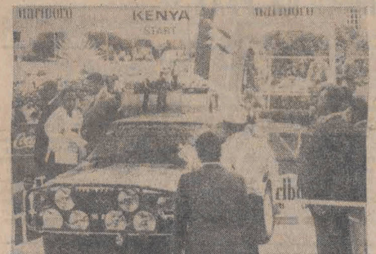
W czwartek w stolicy Kenii - Nairobi rozpoczął się XXX Rajd Safari. N/z: jako pierwszy z 71 uczestników imprezy na trasę wyruszył Fin Hannu Mikkola w Audi Quattro a honorowym starterem był prezydent Daniel arap Moi (u prawej).