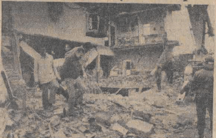
N/z: na miejscu eksplozji.