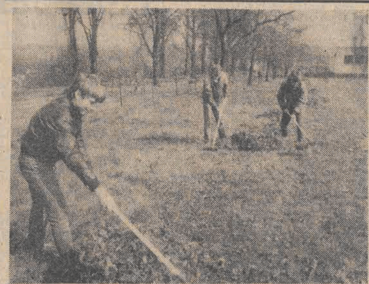
Wrocławską młodzież zrzeszoną w ZSMP podjęła czyn na rzecz pokrycia kosztów wyjazdu na Festiwal Młodzieży w Moskwie. Na zdjęciu: zetesempowcy pracują przy porządkowaniu otoczenia kapliczki Morskie Oko we Wrocławiu.