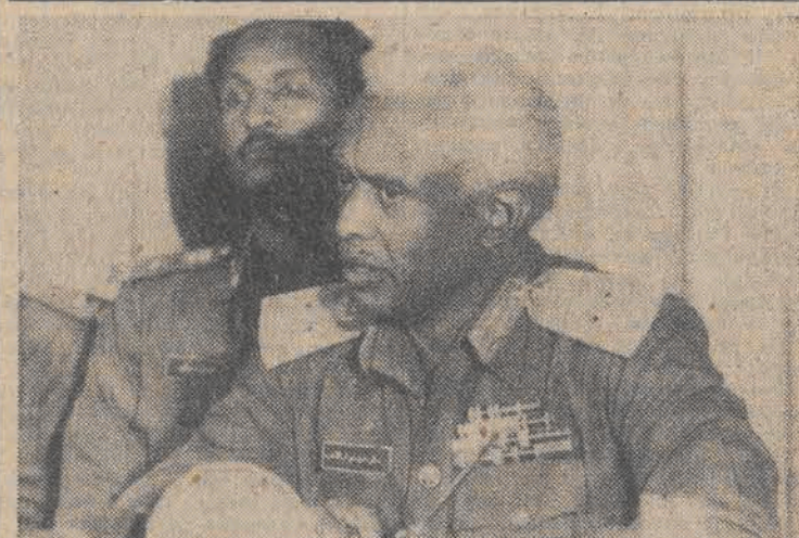
Pierwsza konferencja prasowa nowego przywódcy Sudanu gen. Abdul-Rahmana Suwar el Dahaba w Chartumie.