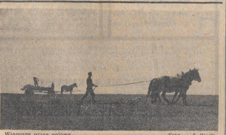
Wiosenne prace polowe.

temat wielu aktualnych problemów polityki zagranicznej. W centrum dyskusji znalazły się sprawy dotyczące rozbrojenia, przy czym główną uwagę poświęcono zagadnieniom ograniczenia i redukcji zbrojeń rakietowo-nuklearnych, a także sprawie niedopuszczenia do militarystyki kosmosu. Omawiano także sprawy dotyczące stosunków dwustronnych.