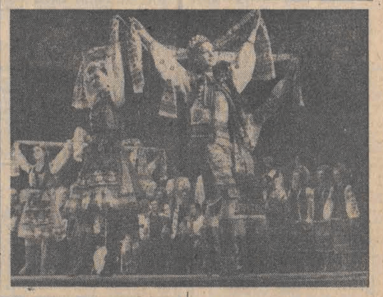
Ukraiński Ludowy Zespół Pieśni i Tańca im. G. Wierłowski liczący ponad 100 artystów rozpoczął występy w Polsce w ramach Dni Kultury Radzieckiej. Zabrzańską publiczność powitał zespół bardzo serdecznie, następnego koncertu odebrał się w Rybniku, Dąbrowie Górniczej, Opolu, Łodzi i Warszawie.