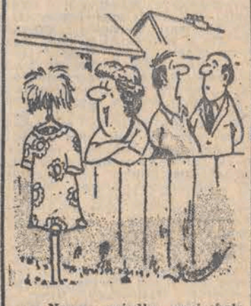
— Nasza sąsiadka wyjechała na urlop.

Wszystkie sobotnio-niedzielne dzienniki zachodniemieckie przyniosły na pierwszych stronach doniesienia o decyzji przedłużenia Układu Warszawskiego, podkreślając jednocześnie, iż jego dalsze istnienie uzależnione jest od NATO. W wypadku rozwiązania tego paktu bądź też utworzenia systemu kolektywnego bezpieczeństwa w Europie, Układ Warszawski może zostać rozwiązany — piszą gazety nadreńskie.