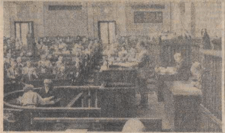
N.M. na sali obrad.