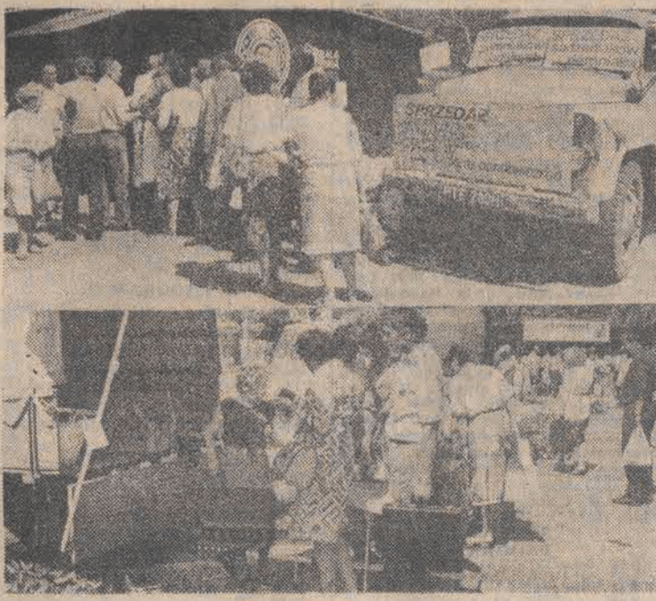
Dużą popularnością cieszy się kiermasz pn. „Wszystko dla działkowca”, zorganizowany pod patronatem „DL”.

Trzej zimni ogrodnicy - Pankracy, Serwacy i Bonifacy, którzy według „Ludowej” meteorologii przynioszą ochłodzenie między 12 a 14 maja - tym razem zapewnił piękną pogodę. W całym kraju było bardzo ciepło i słonecznie. We wtorek o godz. 14 notowano rzadko spotykane w maju temperatury: 31 st. w Uście i Kolobrzegu, 30 st. w Lebie, Gorzowie, Słubicach, Lesznie, Poznaniu. Najcieplej było na Wybrzeżu i w zachodniej części kraju. W Warszawie termometry wskazywały 28 st. najchłodniej było na południowym wschodzie - gdzie termometry wskazywały tylko 24 st.