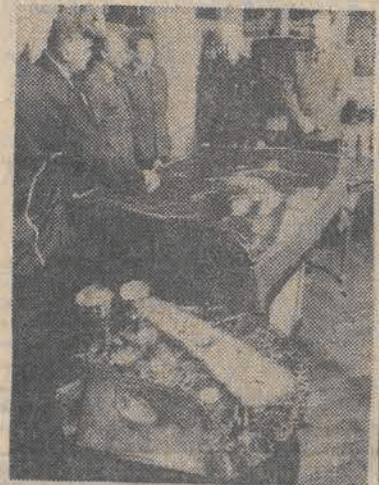
W październiku 1981 r. dokonano zuchwałego włamania do Muzeum Archeologicznego w Poznaniu. Zginęły bezcenne skarby kultury polskiej. Wrzoraż na ręce dyrektora placówki przekazałi odzyskane przedmioty wartości 150 mln zł, wśród nich obraz van Dycka.

26 maja obchodzimy tradycyjne Święto Matki. Z tej okazji Prezydium Rady Obywatelskiej Budowy Pomnika - Szpitala Centrum Zdrowia Matki - Polki wystosowało list z życzeniami do kobiet - matek oraz zaapelowało do całego społeczeństwa o dalszą ofiarność potrzebną do wzniesienia tej szczególnej placówki służby zdrowia. Oto treść listu: SZANOWNE POLSKIE MATKI! DRODZY RODACY! Przed kolejnym świętem wszystkich matek, w drugą rocznicę powołania Rady Obywatelskiej Budowy Pomnika - Szpitala Centrum Zdrowia Matki - Polki, pragniemy zwrócić się do was z życzeniami, słowami... ((Dalszy ciąg na str. 3))