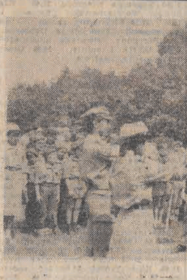
26 bm. w Puszczy Kampinoskiej odbył się XVIII Marsz Patrolowy Szlakiem Walk i Męczeństwa zakończony w Palmirach, gdzie z okazji 60-lecia zwycięstwa odbyła się patriotyczna manifestacja. N/z: podczas uroczystości.

duje się dalszy wzrost wzajemnych obrotów w nadchodzącym pięcioletciu. Zgodnie z tą umową będziemy importowali z ChRL takie towary i wyroby jak ryż, herbata, bawełna i tkaniny dzianinowe, konfekcje tekstylna i obuwie tekstylnogumowe. Nasz eksport do ChRL obejmuje m. in.: bieliznę i kołnierze energetyczne, sprzęt górniczy, samochody osobowe i ciężarowe, wyroby hutnicze, miedź i walcówki miedziane.