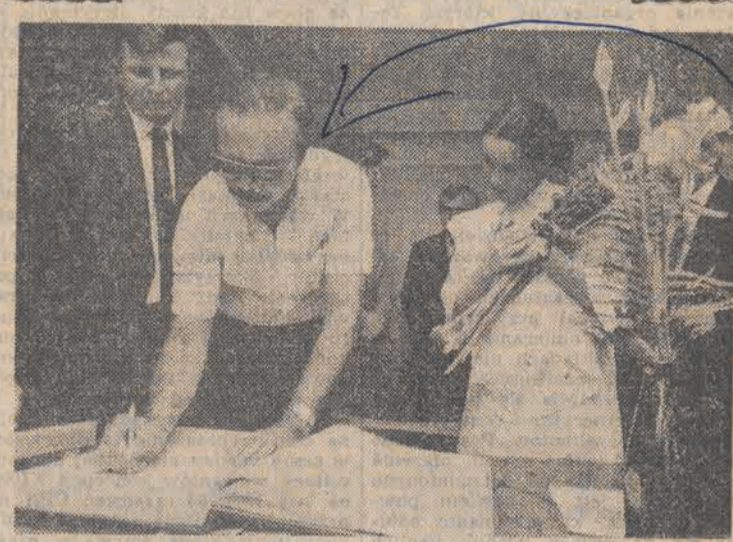
Bohaterowie brazylijskiego serialu wpisali się do księgi budowy Centrum Zdrowia Matki Polki.

Publiczność tak szczerze wypełniająca łódzką Halę Sportową miała dotychczas tylko największej rangi zawody sportowe lub występy znanych grup rockowych. Tym razem tysiące widzów śledziła wieść o spotkaniu z L. Santos i R. de Falco, czyli z Isaurą i Leonciem, bohaterami wzburzającego najrozmaitsze emocje brazylijskiego serialu.