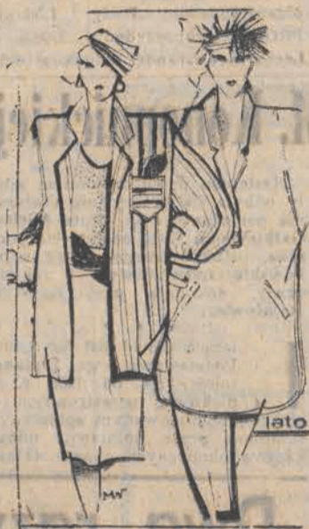
Taaaka koszula duża, rzecz można ogromna jest przebo-