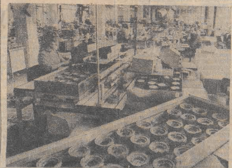
Znany producent budzików. Zakłady Mechanizmów Precyzyjnych „Mera-Poltek” w Łodzi obchodzi 40-lecie swojego istnienia. Produkują tu budziki o napędzie mecha-

micznym oraz elektroniczno-kwarcowym. W tym roku na rynek przeznaczono 160 tys. budzików i 45 tys. zegarków. N.z. montaż budzików