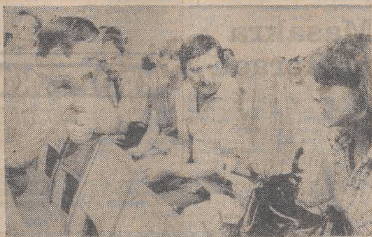
Wczoraj w Warszawie zebrało się VII Forum Młodego Pokolenia. Tematem spotkania zorganizowanego przez PRON było: „Jak wyobrażam sobie Polskę w 1990 roku”. N.z. w przerwie obrad.