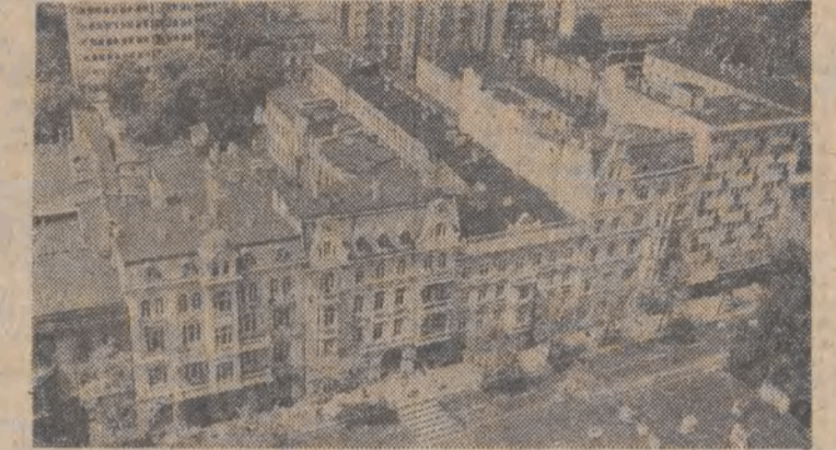
Piotrkowska z lotu ptaka.

Co najmniej 8 tys. dewleasantów wzięło udział w eliminacjach do konkursu na „najpiękniejszego nogę” Halli. Finał tej imprezy odbędzie się 25 sierpnia w San Benedetto del Tronco (środkowe Włochy), oprac. ki