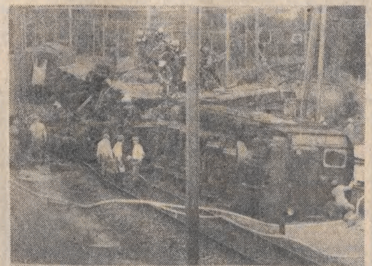
14 bm. w pobliżu Renos (Szwajcaria) pociąg pasażerski wpadł na dwie łok metry wyprzedził jace z przeciwnika 3 osób zginęło, 42 odniosły rany. Przyczyną katastrofy była źle nastawiona zwrotnica.

Jako potwierdzenie fundamentalnej zasady oddzielenia Kościoła od państwa przyjęto w USA wynik głosowania w Senacie amerykańskim w sprawie modłów w szkołach publicznych, niepomysłowy dla zwolenników praktyk religijnych w szkołach. Senat USA odrzucił stosunkiem głosów 62:36 projekt ustawy przedłożony przez konserwatywnego senatora Jesse Helmsa zezwalającej na wprowadzenie do szkół publicznych w Stanach Zjednoczonych dobrowolnych praktyk religijnych. Inicjatorzy tej ustawy chcieli doprowadzić do unieważnienia orzeczenia Sądu Najwyższego, który uznał decyzje władz niektórych stanów, wprowadzające praktyki religijne do szkół lub tzw. chwile ciszy religijnej, za niezgodne z Konstytucją Stanów Zjednoczonych. Senator Helms usiłował przekonać Senat, iż „religijna wolność nie oznacza wolności od religii”. Jednakże to stanowisko spotkało się z powszechną krytyką, w tym również kilku senatorów konserwatywnych. Porażka senatora Helmsa i jego zwolenników oznacza więc utrzymanie w mocy decyzji Sądu Najwyższego USA zabraniającej „uprawiania wszelkich praktyk religijnych” w szkołach. Senator Orrin Hatch oświadczył, że przyjęcie ustawy Helmsa jest niemożliwe, bowiem „jest ona sprzeczna z pierwszą poprawką do Konstytucji, usuwającą religię z życia publicznego”. Inny senator, Lowell Weicker powiedział, że „amerykańskie społeczeństwo podchodzi z ostrożnością do telewizyjnych kaznodziej, którzy wiążą religię z rządami”.