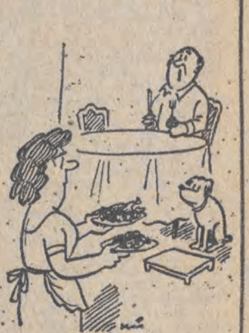
— Ciekaw jestem koma najpierw dasz jeść!