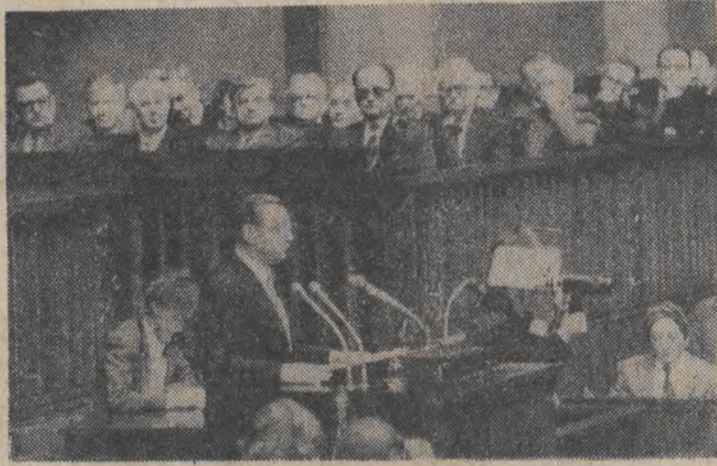
Przemawia premier Zbigniew Messner.

Sejm podjął uchwałę, w której stwierdza ważność wyborów posłów