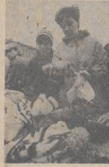
JARMARK NAD ŁÓDKĄ — ZAKONCZONY. Worek był ostatnim dniem handlu na „Jarmarku nad Łódką”. Przez dziewięć dni, łącznie z sobotą i niedzielą, łodzianie mogli dokonywać zakupów różnych różności na „pehlim targu”. Impreza, zorganizowana pod patronatem naszej redakcji, cieszyła się przez wszystkie dni dużym powodzeniem. K. K.

stałe do menu naszej reprezentacyjnej restauracji. Aby przybliżyć łodzianom kuchnię saksońską możemy zdradzić, że obfituje ona w urozmaicone dania mięsne, okraszone brunatnymi sosami (tajemnicza kuchnia), świetne sałatki warzywne oraz apetyczne desery. Dla smakoszy jest też golonka berlińska z kwaszoną kapustą. Tak więc dobrze zjeść można w restauracji „Karl-Marx-Stadt” podczas tygodnia kuchni saksońskiej, który zakończy się w niedzielę.