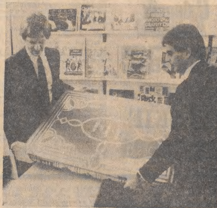
Naj... naj... na 37 Międzynarodowych Targach Książki we Frankfurcie nad Menem. N/z: jedna z największych ksiąg są 4 Ptaki Ameryki; 4-tomowa edycja kosztuje ponad 15 tys. dolarów...

Właściciele barów i knajpek podzelił do akcji filozoficznie. Ich stanowisko wygląda następująco: „To zwracanie kijem Wisły. Ci co pili będą nadal pić, a ci co nie pili nie zaczną. My na tym z pewnością nie ucierpimy”. Przeciwnicy kampanii — stali bywalcy bistro, gdzie wychylają niejedną „głębszy” powtarzając maksymę ponoć Legii Cudzoziemskiej: „Alkohol zabija powoli, ale to nie szkodzi, nam się nie spieszy”. Sceptycy uważają, że lepiej robić coś niż nic, jednakże koszt tej akcji jest większy od zakładanych wyników. Są więc zdania, że należałoby zająć się prawdziwymi przyczynami alkoholizmu — bezrobociem, ubożstwem ludności, brakiem przyszłości. Przeważają jednak pozytywne opinie. Większość pytaných przez dziennikarzy sądzi, że ta kampania zapoczątkuje zmianę opinii o mieszkańcach Brestu, a gdy pojawią się pozytywne wyniki, to może inni pójdą ich śladem... (W)