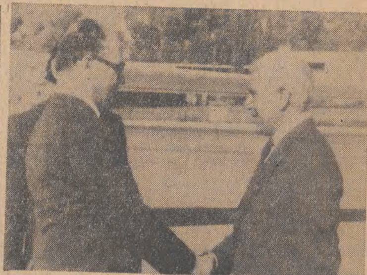
Na zdjęciu: powitanie na lotnisku w Algierze.

Przed wyjazdem polskiej delegacji z Libii odbyła się uroczy-