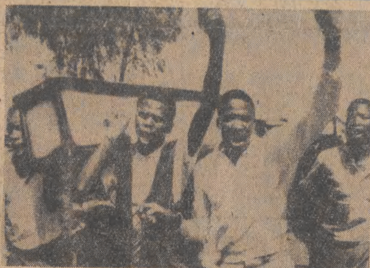
W mieście Leandra w RPA odbył się manifestacyjny pogrzeb mieszkańca miasta, który został zastrzelony przez policję w czasie zamieszek przed trzema dniami.

Agenci policji śledzili psa stwierdzili naocznie, że przynosi łupy do stóp pana, co stało się wystarczającym dowodem by wsadzić pana do więzienia. Opr. (M. C.)