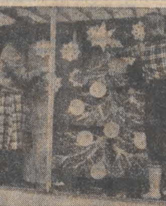
W witrynach łódzkich placówek handlowych i gastronomicznych pojawiły się pierwsze świąteczne dekoracje.