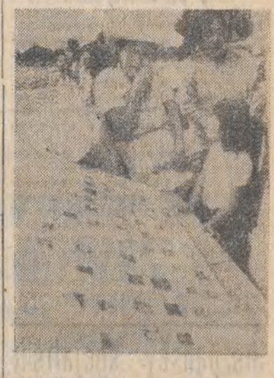
Przed pałacem prezydenckim w Guatemali odbyła się demonstracja rodzin 656b, które zginęły podczas rządów junty wojskowej.

Już jutro wydanie święteczne „Dziennika”!