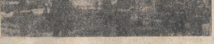
N.Z.: ekipy ratunkowe i straż pożarna w akcji po wybuchu w Neapolu.

Z nie wyjaśnionych przyczyn, w sobotę, parę minut po godzinie piątej rano nastąpił w Neapolu wybuch jednego z wielkich zbiorników z benzyną w magazynach i przepompowni paliw płynnych, powodując śmierć pięciu osób. Wskutek eksplozji, a następnie pożaru, który bardzo szybko rozszerzył się na inne cysterny, ok. 250 osób odniosło poparzenia i rany, kilkanaście jest w bardzo ciężkim stanie. Mimo skoncentrowanej akcji straży pożarnej z Neapolu i kilku sąsiednich prowincji, do