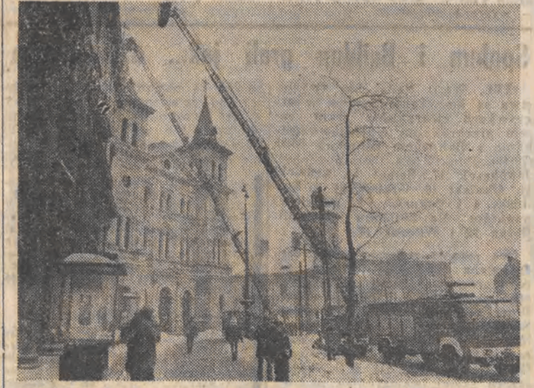
Dwie 30-metrowe drabiny pojawiły się wczoraj na pl. Wolności w Łodzi. Obecność stu strażaków z kompanii odwodowej nie była spowodowana żadną akcją, lecz ćwiczeniami, których celem była próba ewakuacji pracowników i eksponatów Muzeum Archeologicznego w Łodzi na wypadek pożaru.