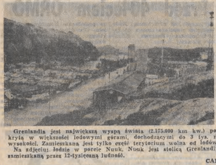
Greenlandia jest największą wyspą świata (2.175.000 km kw.) pokrytą w większości lodowymi górami, dochodzącymi do 3 tys. m wysokości. Zamieszkała jest tylko część terytorium wolna od lodów. Na zdjęciu: lodzie w porcie Nuuk. Nuuk jest stolicą Grenlandii, zamieszkałą przez 12-tysięczną ludność.