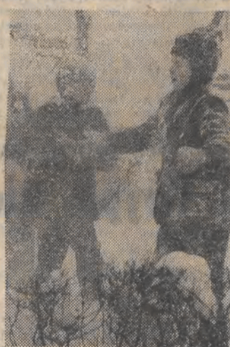
Z simy najbardziej cieszą się dzieci...

12 i 13 bm. odbędzie się w Warszawie spotkanie konsultacyjne przewodniczących grup Unii Międzyparlamentarnej państw socjalistycznych. Spotkania takie odbywają się corocznie, a miejscem obrad są kolejno stolice tych krajów. Warszawa była ostatnio gospodarzem takiego spotkania w 1975 roku. Celem spotkań przewodniczących grup narodowych z państw socjalistycznych jest wymiana doświadczeń, ocena dorobku u siebie i w poprzednim okresie oraz problematyka współpracy na forum unii, jak też w stosunkach bilateralnych i wielostronnych.