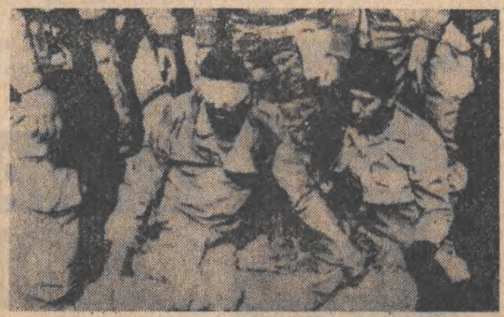
N/z.: ranni żołnierze Irańczy w Bagdadzie.