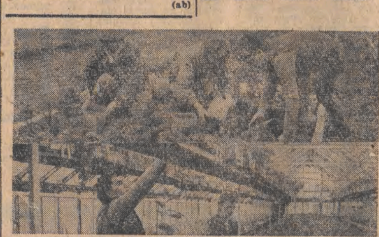
Dzisiaj jeszcze w szkółce Łódzkiego Przedsiębiorstwa Ogrodniczego, jutro już na kiermaszu „Wszystko dla działkowca” w Hali Sportowej.