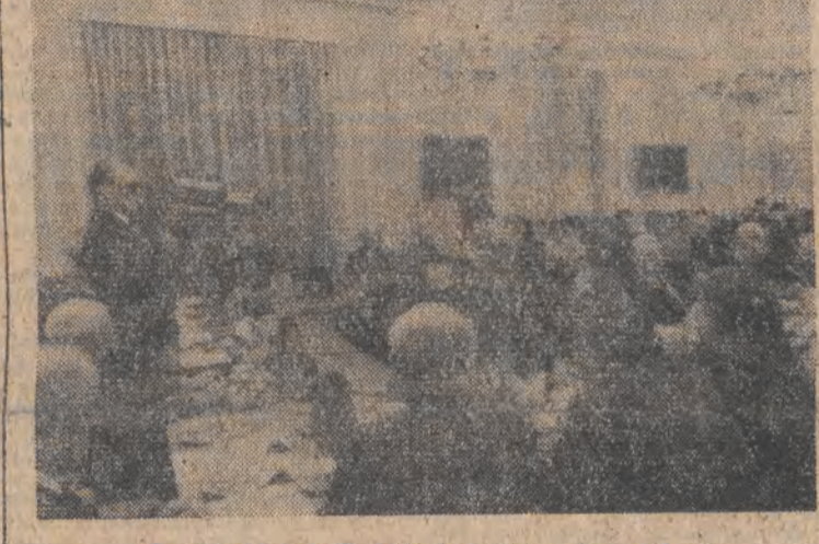
Na zdjęciu: gen. W. Jaruzelski otwiera spotkanie.

W spotkaniu uczestniczył Zbigniew Messner. Sprawozdawcy PAP przysłuchujący się w Belwederze dyskusji