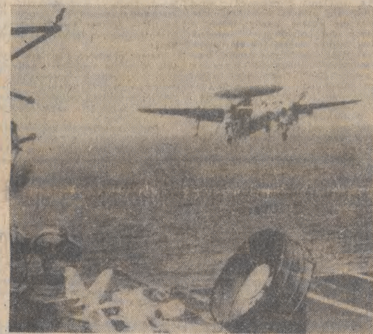
Amerykański samolot radarowy Hawkeye ląduje na pokładzie lotniskowca America po kolejnym nalocie bombowców na Libię.

RANNEGO WTORKOWEGO ATAKU LOTNICZEGO NA BENGHAZI, AMERYKAŃSKIE BOMBY SPADEJ NA KILKANASIE OBIEKTÓW CYWILNYCH. ZNISZCZONE ZOSTAŁY SZKOŁY ORAZ OŚRODEK OPIEKI NAD INWALIDAMI, A TAKŻE USZKODZONO BARDZO ZNISZCZONO KILKA SAMOLOTÓW CYWILNYCH, STOJĄCYCH NA PEYCIE LOTNISKA BENINA W BENGHAZI.