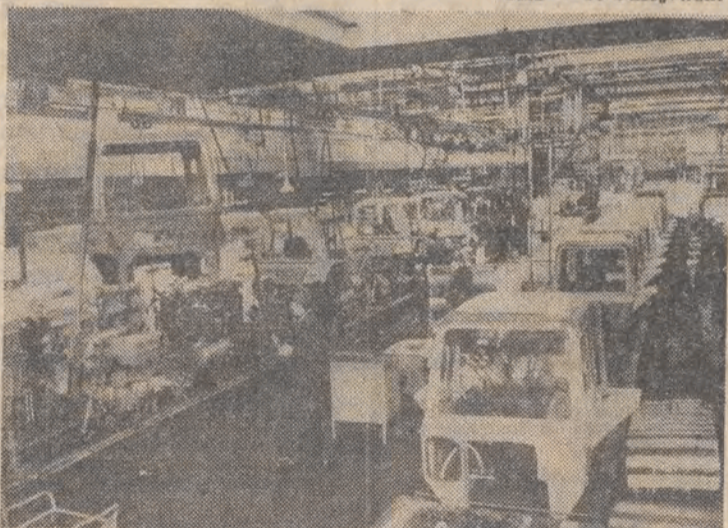
Już od dwudziestu lat trwa wymiana doświadczeń między Fabryką Traktorów Ursus k/Warszawy a Fabryką Traktorów w Mińsku (ZSRR). N/z: wspólna praca polskich i radzieckich robotników w Fabryce Traktorów w Mińsku.