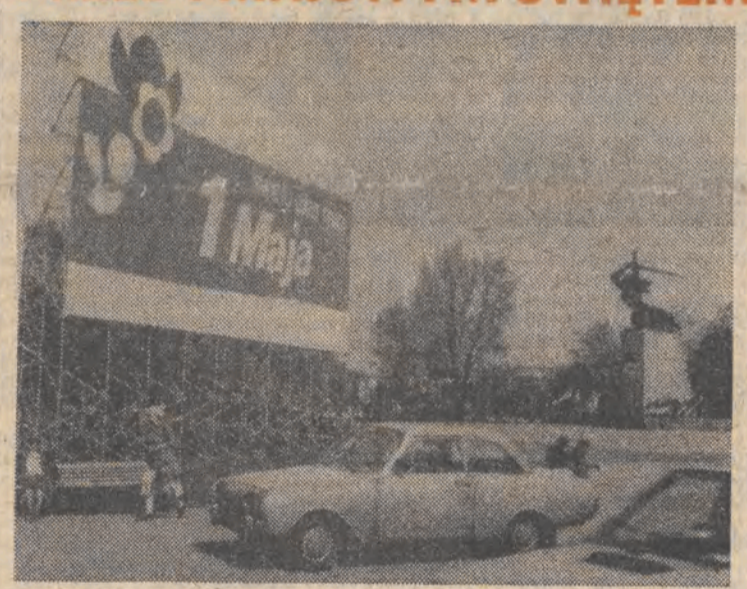
Przed uroczystościami 1 Maja warszawskie ulice i gmachy przybierały odświętny wygląd. N.z.: dekoracje 1-majowe na placu Teatralnym.

W dniach poprzedzających 1-majowe święto odbywały się, zgodnie z wieloletnią tradycją, uroczyste spotkania ludzi pracy, akademie i okolicznościowe koncerty. Trwały jednocześnie przygotowania do robotniczych pochodów 1-majowych festynów i zabaw. Spotkania służą uhonorowaniu weteranów pracy, tych którzy budowali srebrny ludowej państwowości i swą pracą przyczynili się do rozwoju kraju, jak i tych, którzy obecnie swoją postawą, zaangażowaniem, wydajnością pracy dają przykład innym. Tegoroczne święto obchodzone jest pod hasłami: jedności, pracy i walki o pokój i postęp społeczny.