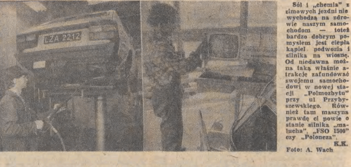
Sól i „chemia” z zimowych jezdni nie wychodzą na zdrowie naszym samochodom — to jest bardzo dobrym pomysłem jest ciepła kąpieli podwozia i silnika na wiosnę. Od niedawna można taką właśnie atrakcję zaufundować swojemu samochodowi w nowej stacji „Polmozblytu” przy ul. Przybyłszewskiego. Również tam maszyna sprawdzi ci powie o stanie silnika „malucha”, „FSO 1500” czy „Poloneza”. K.K.

„członkowie Wojewódzkiej Komisji do Walki ze Spekulacją zajmowali się analiza stanu przemysłu mleczarskiego. Oceniono, że sytuacja panująca w sklepie, przetwórstwie i handlu mlekiem i jego przetworami nie jest zła, choć nie można jej uznać za wzorową. Nadal bowiem zdarzają się nieprawidłowości przy ocenie skupowanego od producentów mleka, kontrole w mleczarniach mają uwagi co do m.in. mikrobiologicznej jakości produktów, w sklepach oferuje się klientom towar, który bez specjalistycznego sprzętu, na wchł i oko ocenić można jako nieswasty. Stąd też konieczność stałej kontroli wszystkich ogniw „mlecznego” łańcucha — od czystości konwii na mleko do temperatury w sklepowej lodówce chłodniczej. K.K.