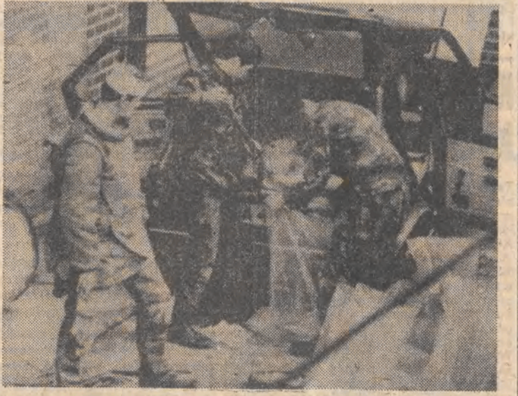
Zołnierze brytyjscy rozbrajają samochód pułapkę pełen materiałów wybuchowych w centrum Belfastu. Miał on eksplodować na znak protestu przeciwko zabiciu jednego z członków IRA 28 bm.

W poniedziałek rozpoczęła się w Wenecji sesja Zgromadzenia konsultacyjnego Unii Zachodnioeuropejskiej (UZE), której członkami są: Belgia, W. Brytania, Francja, RFN, Włochy, Luksemburg i Holandia. W obradach uczestniczy około stu parlamentarzystów z krajów członkowskich. Toczą się one w warunkach ostrego środka bezpieczeństwa podjętych w obawie przed ewentualnym zamachem terrorystycznym. Powołując się na miarodajne źródła, zachodnie agencje informacyjne podają, że celem obrad gremium UZE ma być próba uzgodnienia wspólnego stanowiska przed rozpoczynającym się w przyszłym tygodniu w Tokio zachodnim szczytem gospodarczym siedmiu najbardziej uprzemysłowionych państw kapitalistycznych.