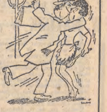
— Dlaczego ty na wiosnę nie jesteś tak zmęczony jak inni mężczyźni?!

Kwietniowe upały nie potrwają długo. Instytut Meteorologii i Gospodarki Wodnej przewiduje w okresie od 30 kwietnia do 4 maja pogorszenie pogody i spadek temperatury. Spodziewane jest zachmurzenie umiarkowane, okresami duże z opadami. Nastąpi ochłodzenie. Temperatura maksymalna spadnie z 17—23 st. do 7—13 st., a minimalna z 5—10 st. do 2—7 st. Moga nastąpić miejscami przygruntowe przymrozki. Wiatr umiarkowany, okresami dość silny, przeważnie północno-wschodni. (PAP)