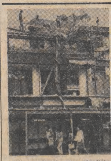
Przed nadchodzącym Mundialem ekipy remontowe doprowadzają — do porządku domy w zniszczonych trzęsieniem ziemi dzielnicach stolicy Meksyku.

ryka Chopina w wykonaniu Lidii Grychtolówny.