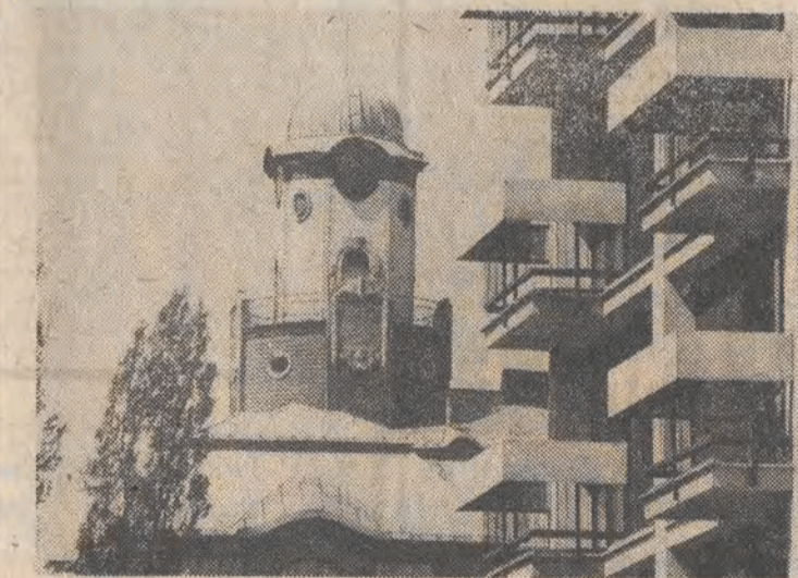
Stara i nowa Łódź w obiektywie A. Wacha.

„Jugendturist” nie jest w stanie wysłać kolejnej grupy młodzieży NRD do Badenii-Wirtembergii, ani też przyjąć tamtejszych grup u siebie. Odpowiedzialność za tego rodzaju historię antykomunistyczną spada całkowicie na władze zachodniemieckie.