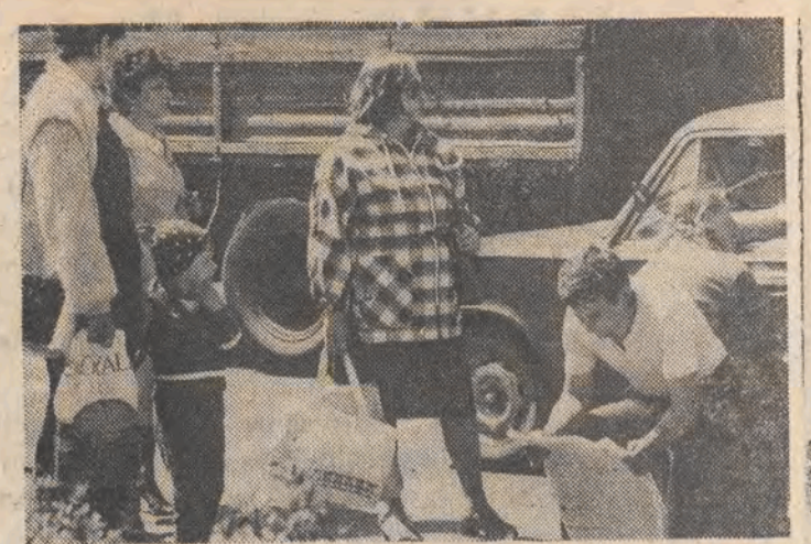
Gdyby była ławeczka, wygodniej czekałoby się na tramwaj. Ale cóż, dobry i koszt na śmieci...

Talony subskrypcyjne na 22-tomową Wielką Encyklopedię Powszechną PWN otrzymać będzie można na przełomie lat 1986-1987. (je)