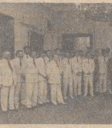
Nasi piłkarze znakomicie prezentowali się w mundialowych garniturach, co widać doskonale na zdjęciu w czasie spotkania z premierem Zb. Messnerem. Obecnie garnitury odwieszono do szaf ośrodka sportowego „Bahia Escondida”, a zawodnicy sumiennie trenują, przygotowując się do czekających ich spotkań finału „Mexico — 86”.

W ostatnią sobotę maja, na słynnym Stadionie Arteków w stolicy Meksyku meczem Włochy — Bułgaria rozpocznie się największa impreza tegoroczna na naszym globie, piłkarskie mistrzostwa świata „MEXICO — 86”. Póki co, 21 finalistów przygotowuje się do tego wydarzenia. Wśród nich piłkarska reprezentacja Polski.