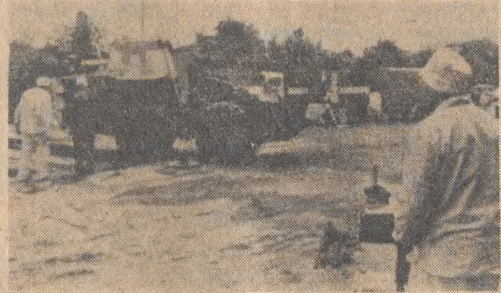
Specjalne samochody i spychacze przed odjazdem na teren elektrowni jądrowej w Czernobylu.

jądrowych. W tym kontekście powinny być też podjęte sprawy dofinansowania MAEA dla prowadzenia takiej rozszerzonej działalności.