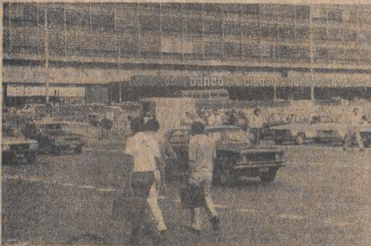
Niedaleko obelisku mieści się filia miejskiego banku Buenos Aires — jednego z kilkunastu banków stolicy Argentyny.