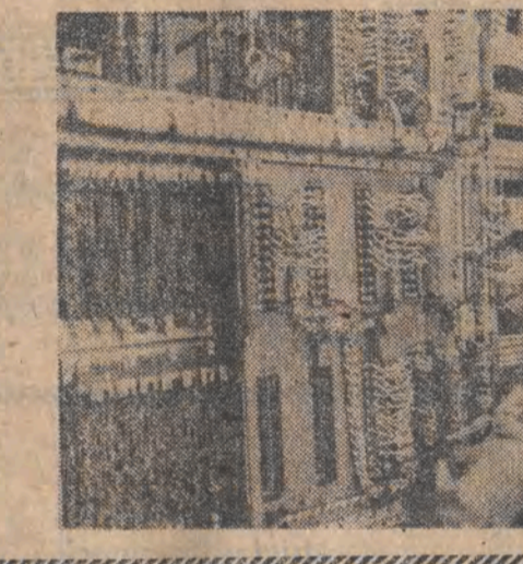
W Zakładzie Aparatury Jądrowej „POLON” w Zielonej Górze produkuje głównie urządzenia kontroli dozymetrycznej systemu „Sejwal” dla elektrowni atomowych...