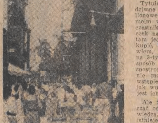
Nawet w niedzielę popołudnie na bulwarze San Rafael w Starej Hawanie spotkać można wielu przechodniów.

Tytułowe pytanie może wydawać się dziwne w odniesieniu do ponad dwumilionowej metropolii. A jednak... Przed moim wyjazdem do Hawany pewien uczestnik jednej z „orbisowskich” wycieczek na Kubę zapytał mnie: „Po co pan tam jedzie? Przecież tam nie można kupić, bo wcale nie ma sklepów”.