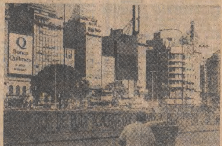
Żeby dostać się na drugą stronę awenidy 9 de Julio, trzeba przejść 200 metrów.