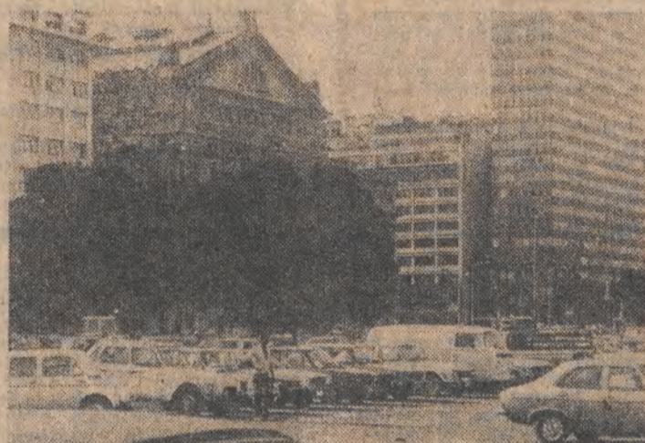
Przysłonięty drzewami Teatr Colón — piąta scena operowa świata.