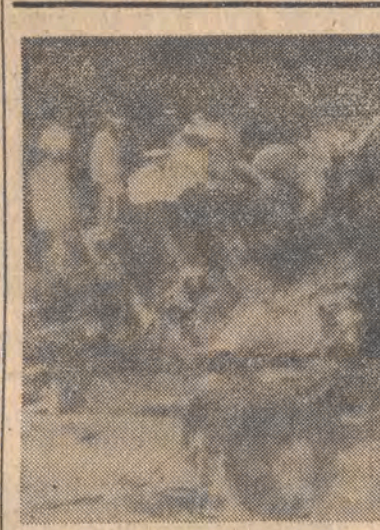
Na Synaju rozbił się samolot egipskich linii lotniczych Air Sinai odbywający lot z Sharm el Sheikh do Kairu. Zginęło 20 pasażerów, a 5 osób uratowało się. N/z: ekipy ratownicze przeszukują wrak.

Według informacji policji hiszpańskiej, kilkanaście osób odniosło poważne obrażenia ciała, a kilkadziesiąt aresztowano.