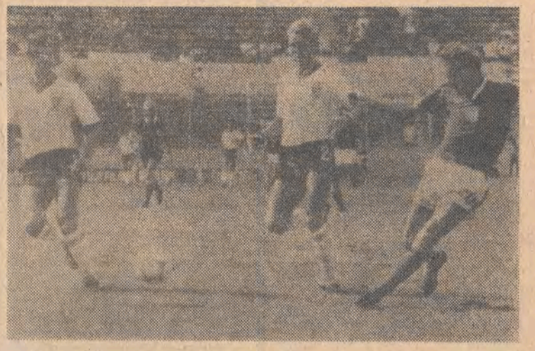
Fragment środowego meczu Polska — Anglia, przegranej przez nasz zespół 3:0. (Wszystkie bramki zdobył dla Anglików — Lineker). Z. Boniek też próbował strzelać, ale nie zmusił do kapitulacji Shiltona.