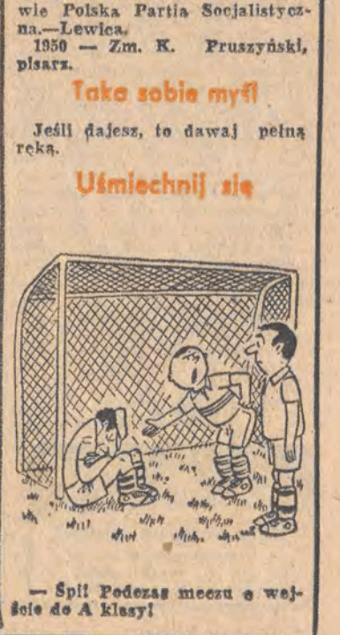
— Spół Fedezas meczu e wejście do A klasy!

W 164 dniu roku słońce weszło o godz. 4.14, zajądzij zaś o 20.58. Wnieniny obchodzą: Antoni, Lucjan, Gracja, Tobiasz Dyżurny synoptyk w dniu dzisiejszym przewiduje dla Łodzi następującą pogodę: zachmurzenie małe i umiarkowane, okresami wzrastające do dużego i możliwe opady przelotne lub burze. Temp. maks. w dzień około 25 st. Wiatr słaby i umiarkowany, w czasie burz porwany, o kierunkach wschodnich i północnych. Ciśnienie o godz. 19 wyniosło 992,6 hPa (744,3 mm). Z kalendarza wydarzeń 1926 — Powstała w Krakowie Polska Partia Socjalistyczna — Lewica. 1950 — Zm. K. Pruszyński, pisarz. Tako sobie myśli Jeśli dajesz, to dawaj pełną ręką. Uśmiechnij się