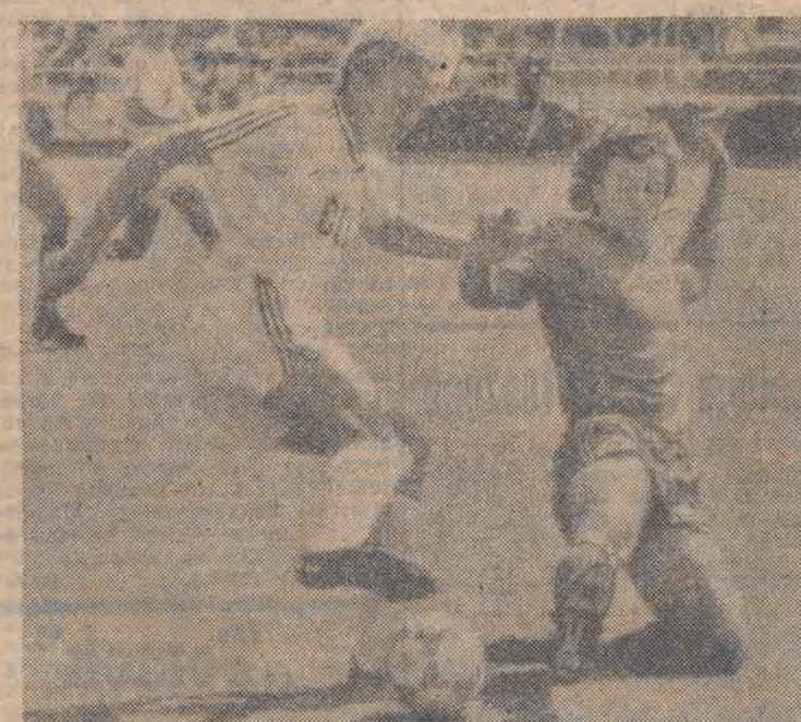
Fragment meczu Belgia — ZSRR zakończony dopiero po dogrywce wynikiem 4:3, uznawanego przez fachowców za jedno z najciekawszych spotkań.

Niemal żałobna cisza zalega słabo, jak zwykle, oświetlone ulice „wiecznego miasta”, gdy zakończył się fatalny mecz z Francją, który oglądało 27 milionów kibiców, czyli niemal co drugi obywatel Włoch. W schowkach i bagażnikach pozostały tysiące kolorowych flag, które jeszcze we wtorek wieczorem wydzierano sprzedawcom na wszystkich większych skrzyżowaniach Rzymu.