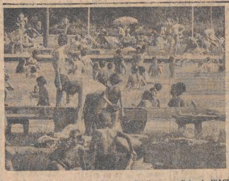
Fala za falą wędrują łódzianie na „Falę”.