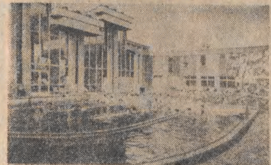
Otwarty basen ciepłowodny.

Basen jest ogromny, ale choć wody dosyć — nikt tu nie pływa. Wszyscy stoją w jednym miejscu, tuż obok siebie, a czarna woda sięga im ponad piersi. Co pewien czas ciecza jakby gotująca się, strzela bąbelkami. Niewatłwiec ten właśnie akwen, choć jest jednym z kilkunastu, składających się na kąpielisko lecznicze węgierskiego kurortu Hajdusoboszo — przyciąga największą liczbę osób, które w gorącej kąpiel borowinowej chcą wyleczyć swe dolegliwości. Niektórzy zamast zanurzyć się w basenie tylko noca, chore nogi, twierdząc potem, że przynosi im to natychmiastową ulgę. W tym samym czasie inni korzystają z kąpeli w pozostałych basenach, m. in. ze szlugała fala morską. Młodzi sportowcy wodnych okupują staw wioślarski, po którym płyną łódki i rowery wodne, dzieci bawią się w brodzikach, a niektórzy