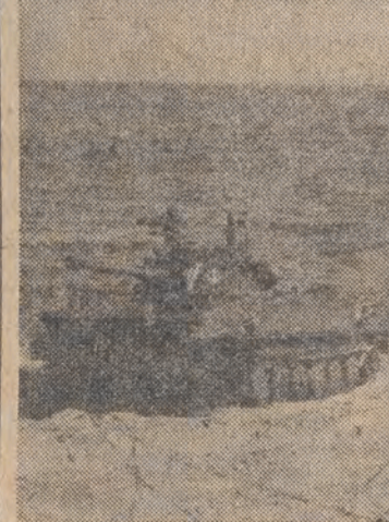
N/z: praktyczne szkolenie progromów załóg i pododdziałów okrętów Marynarki Wojennej z jedno stąką Obrony Wybrzeża.

Doczekaliśmy się najlepszego meczu w „Mundiali”. gdy to, do pokazali Francuzi i Brazyljczycy, na długo pozostanie w pamięci kibiców. Dlaczego tak się stało? W moim przekonaniu, na boisku spotkali się dwaj królowie — Europy i Ameryki. Zadna z drużyn nie chciała wyeliminować najgroźniejszych przeciwników i grać na indywidualne „krwiele”, wychodząc z założenia, że jesteśmy najlepszy i niech się rywale martwią o wyłączenie naszych najbliższych punktów. W efekcie na boisku doszło do takiej sytuacji, że każdy zespól mógł pokazać to, co było jego największym atutem. Nie było zatem żadnych ograniczeń we wspomnianych przez mnie wyżej elementach walki, obyło się też, bez trenerskich, taktycznych ambicji.