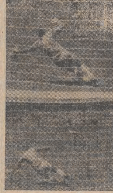
N/z: u góry po lewej — celnym strzał Bellone’a a po prawej — Branco; u dołu po lewej „puddo” Platini’ego a po prawej Cesar’a.

BRAZYLIA: Carlos Gale — Josimar, Edinho, Julio Cesar, Branco — Alemoa, Elzo, Socrates, Junior (od 91 min. Silas) — Mueller (od 72 min. Zico), Careca.