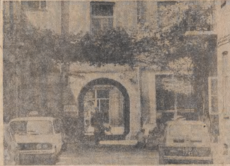
A jednak można wyhodować „zielony most” na klasycznym łódzkim podwórku-studni.

„DZIENNIK ŁÓDZKI” — dziennik Robotniczej Spółdzielni Wydawniczej „Prasa-Książka-Ruch”. Wydawca: Łódzkie Wydawnictwo Prasowe, Łódź, ul. Piotrkowska 86. Druk: Prasowe Zakłady Graficzne w Łodzi. Redaguje kolegium. Redakcja: kod 90-103 Łódź, ul. Piotrkowska 96. Adres pocztowy: „DL”, Łódź, skr. pocz. 89. Telefony: centrala 32 93 00 (łączy z wszystkimi działami). Redaktor naczelny: Henryk Walenda. 36-45-85; zastępcy redaktora naczelnego: 84-06-15 i 33-07-26; sekretarz odpowiedzialny: I i sekretarz: 32 04 75. Sprawy miasta: 33-41-10; społeczno-ekonomiczne: 32-28-23; 33-10-33; fotoreporter: 33-78-97; kultura i oświata: 36-21-60; sport: 32-08-95; łączność z czytelnikami, interwencje i Tel. Usługowy: 33-03-04; sprawy terenowe: 32-23-05 (rekopisów nie zamówionych redakcja nie zwraca). Redakcja nocna: 74-72-01 i 74-71-30. Ogłoszenia i nekrologi — Biuro Reklam i Ogłoszeń, Łódź, ul. Piotrkowska 96, tel. 36-49-70 i ul. Sienkiewicza 3/5, tel. 32-59-11 (za treści ogłoszeń redakcja nie odpowiada). Warunki prenumeraty podają oddziały PUPIK RSW „Prasa-Książka-Ruch” oraz odpowiednie urzędy pocztowe.