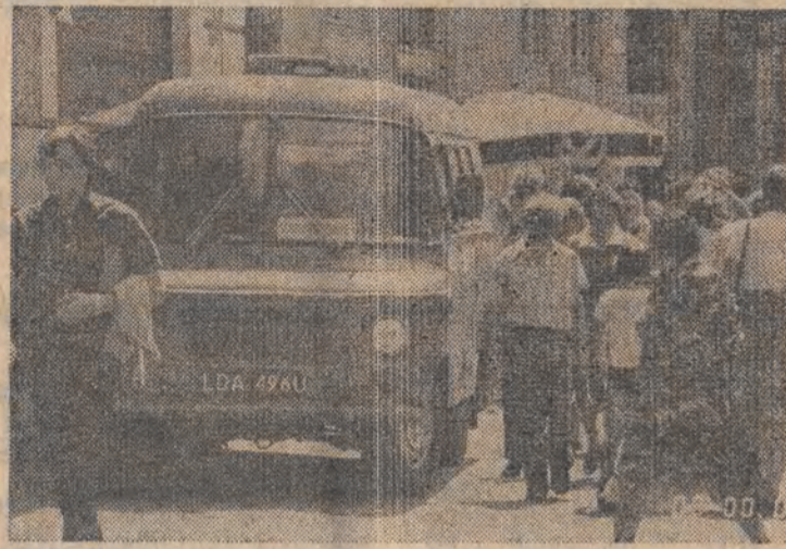
Czy tabliczka „Zaopatrzenie” pozwala na wszystkie — nawet na takie parkowanie?