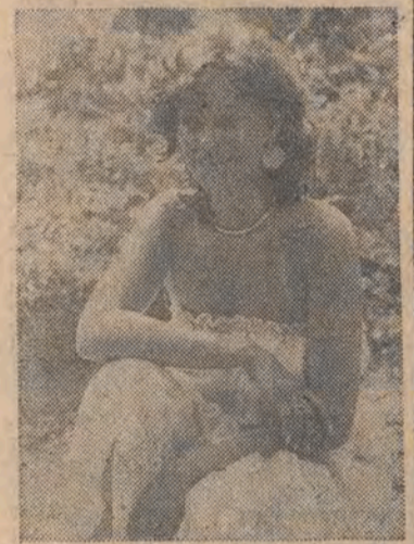
Promienny uśmiech na powitanie lais...