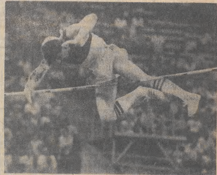
Igrzyska Dobrej Woli — Moskwa. Sielgiej Bubka ustanawia rekord świata w skoku o tyczce — 601 cm. CAF — TASS — telefoto